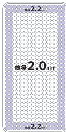
ポケットコイルの図

その秘密は、通常の並行配列のコイル数が 約 420 個に対し、約 1.2 倍の 512 個 (S サイズ) の コイル数と、そこに圧縮フェルトを組み合わせる ことでおどろくほど 超力たい マットレスが誕生！ とにかく硬いしっかりとしたマットレスを お探しの方におススメです。