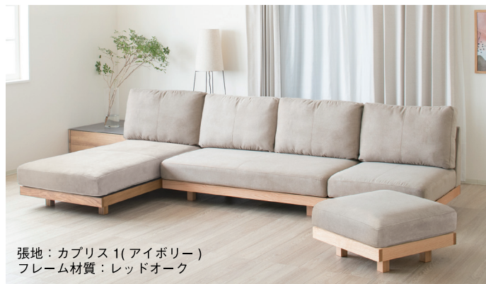
張地：カプリス1(アイボリー) フレーム材質：レッドオーク

❖ フレームの材質とファブリックでお好みのデザインにカスタマイズ。 ❖ 背クッションはカバーリングタイプなのでドライクリーニング可能です。