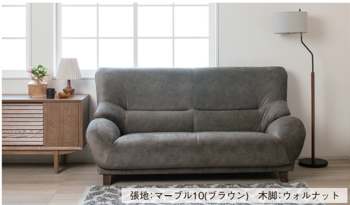
張地：マーブル10(ブラウン) 木脚：ウォルナット