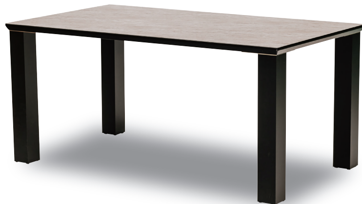
●150ダイニングテーブルリベルテ(アイアン脚タイプ)

別注サイズ:W120、130、140、160、170、190、200cmもご用意しています。