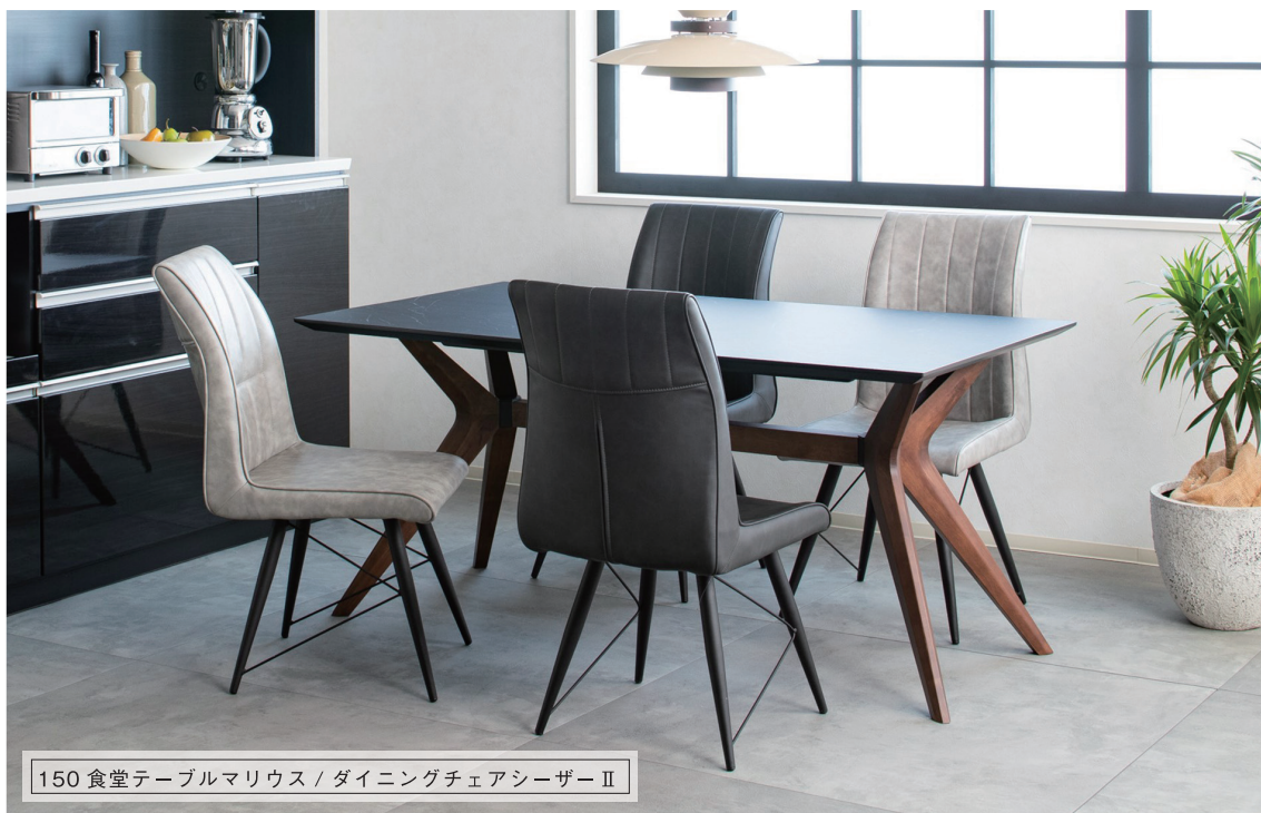
150 食堂テーブルマリウス / ダイニングチェアシーザーⅡ