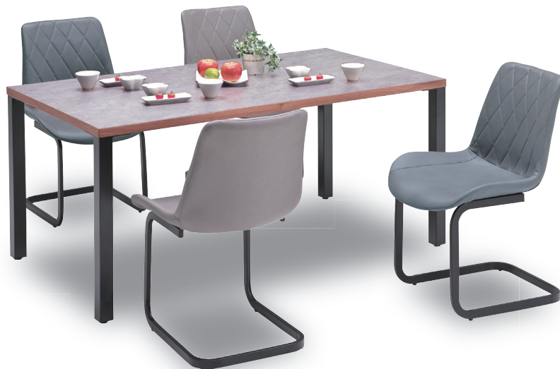
●150ダイニングテーブルリベルテⅡ(面縁WN・アイアン脚Cタイプ) チェア RK(グリーン・グレー)

別注サイズ:W120、130、140、160、170、180cmもご用意しています。