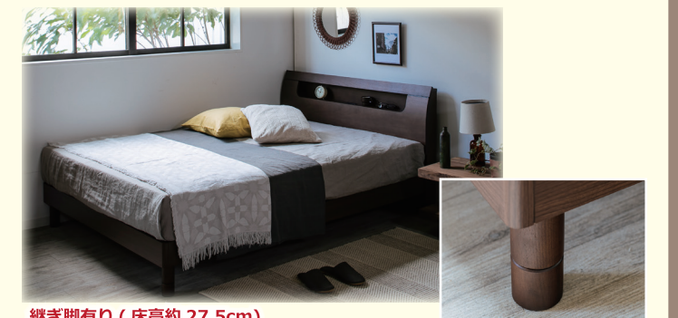
継ぎ脚有り(床高約27.5cm)