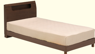
画像:継ぎ脚無し(床高約21m)