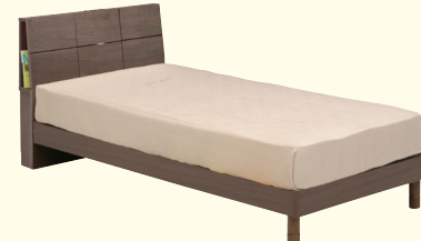
画像:継ぎ脚有り(床高約27.5cm)