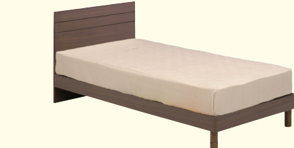
画像:継ぎ脚有り(床高約27.5cm)