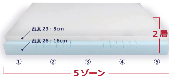
特徴チャート (当社比)