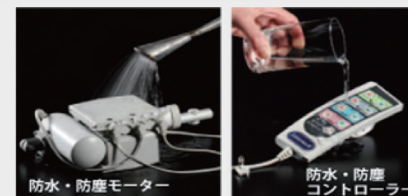
防水・防塵モーター

防水・防塵機能。水などがこぼれても安全。(IP54) さらに、コントローラーは手元に高圧電流が流れない構造で安心。