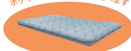
肌触りの良いニット生地