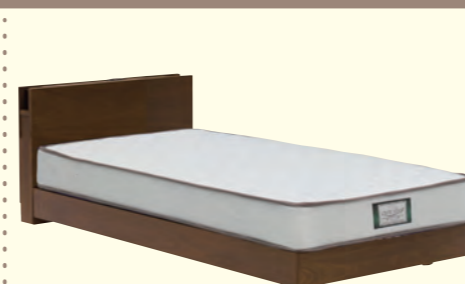
画像: 継ぎ脚無し(床高約18cm)