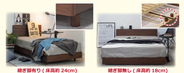
継ぎ脚有り(床高約24cm)