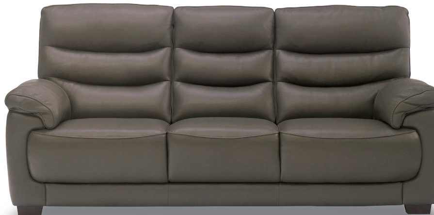
Color : DBR

イタリアンデザインを日本人に合わせてリサイズしました。 しっとりとした滑らかな手触りと、ゆったりとくつろげるハイバックが魅力です。